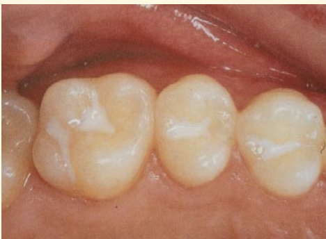
Versiegelte Fissuren der Backenzähne

Je tiefer und enger diese Fissuren sind, desto stärker ist der Zahn kariesgefährdet. Auch die sorgfältigste Zahnpflege reicht nicht aus, da die Borsten der Zahnbürste meist nicht ganz bis auf den Grund der Fissuren hinabreichen.