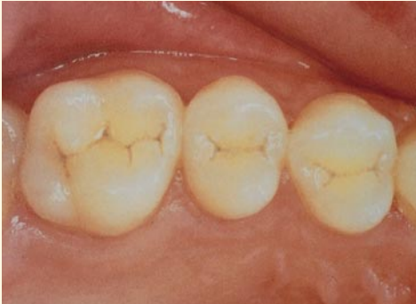
Fissuren der Backenzähne

Fissuren sind kleine Rillen und Furchen in den Kauflächen der Backenzähne. Hier sammeln sich Bakterien an, die Karies verursachen können. Die Fissurenversiegelung ist eine wissenschaftlich anerkannte und bewährte Maßnahme, um die Backenzähne davor zu schützen.